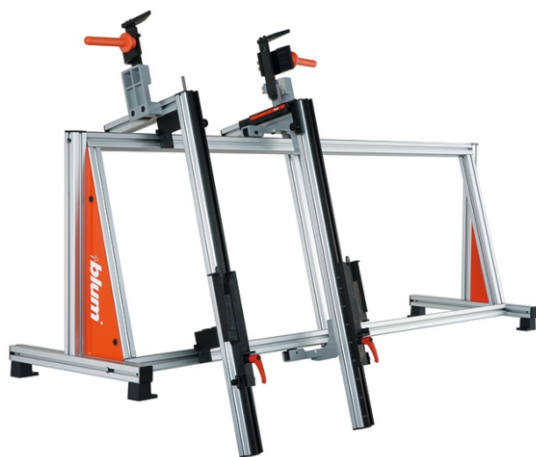
Приспособление за монтаж на TANDEMBOX - BOXFIX